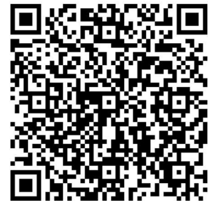
QR – Code zur Anmeldung