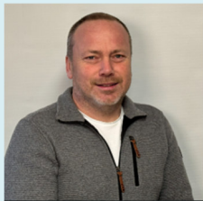
Markus Stettberger 1. Bürgermeister