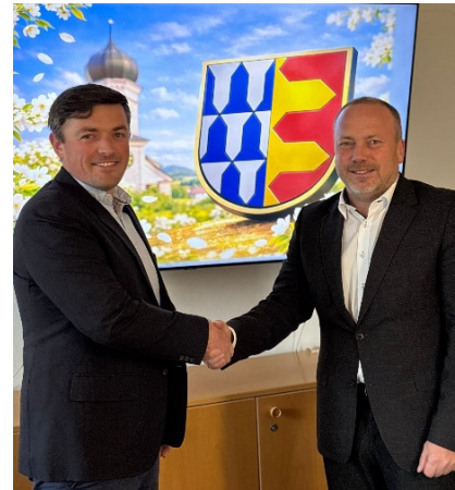
Erster und Zweiter Bürgermeister nach der ersten Gemeinderatssitzung

Wir freuen uns auf einen guten und konstruktiven Austausch mit Ihnen in den kommenden Jahren.